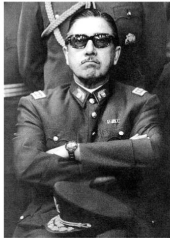
Augusto Pinochet Ugarte