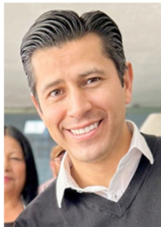
Julio César Chávez Padilla