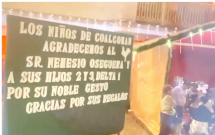
Perverso, utilizar a los niños para promocionar el narco

los deudos debió de expresar: son ching... (censurado) pues ni siquiera pa'su gente tuvo un gesto de solidaridad.-