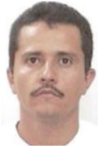
Nemesio Oseguera Cervantes “El Mencho”