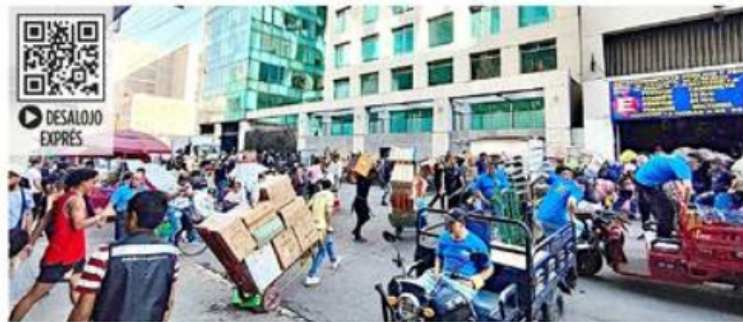
Comerciantes retiraron sus mercancías de Izazaga 89 durante todo el día de ayer.

La plaza de Izazaga 89 fue ocupada entre 2012 y 2018 por las Secretarías de Administración y Finanzas, de Seguridad Pública, del Trabajo, del Sistema de Aguas y del Instituto de In-