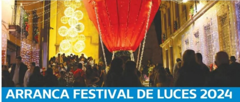
● EL ESPÍRITU navideño llegó a la capital del estado con el encendido de la iluminación del Centro Histórico que marcó el inicio del Festival de Luces 2024, en torno de una de las temporadas más esperadas por las familias zacatecanas. TEXTO Y FOTO: DAVID CASTAÑEDA/ NUESTRA COMUNIDAD A3