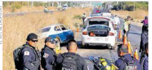
EL SOL DE ZACATECAS

La tarde de este sábado, un accidente en el que se vieron involucrados 2 vehículos compactos, dejó por saldo cuatro personas sin vida y un lesionado; el percance ocurrió a la altura de la comunidad de Martínez Domínguez. Pág. 12