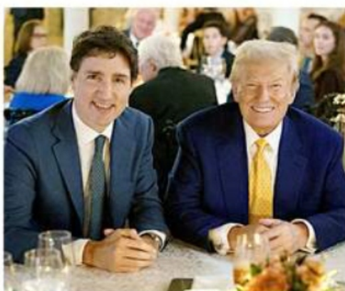
Trudeau y Trump se reunieron la noche del viernes en Mar-A-Lago, propiedad del Presidente electo de EU.

El América ni se despeinó para echar al Toluca en su estadio, repitiéndole la dosis 2-0 para avanzar a Semifinales con global de 4-0. Así, dan un paso más en busca del tricampeonato.