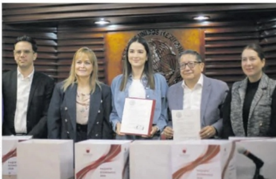
LA COMISIÓN Legislativa de Presupuesto y Cuenta Pública recibió el proyecto.

Dio a conocer que en esta ocasión el presupuesto será por 40 mil 122.4 millones de pesos e insistió en que no existe una baja, ya que "el único decremento que tal vez matiza el crecimiento es por el Instituto Mexicano del Seguro Social para el Bienestar (IMSS Bienestar), pues al conformarse nos quitan 1 mil 358 millones de pesos. "Esto es lo que propició que