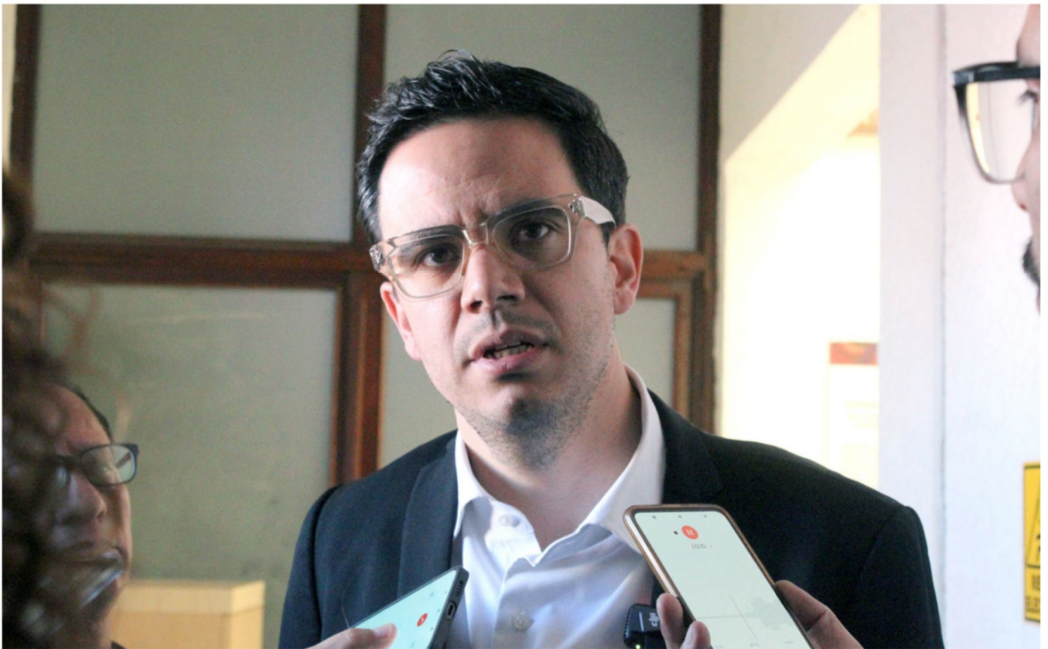
Rodrigo Reyes Mugüerza, secretario general de gobierno