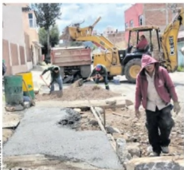
SE PROYECTAN tres pavimentaciones en la capital.