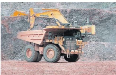
EL SECTOR minero repuntó 26 por ciento.

Según Inegi, el estado quedó como el quinto con la más baja contribución, después de Baja California Sur, Nayarit, Colima y Tlaxcala