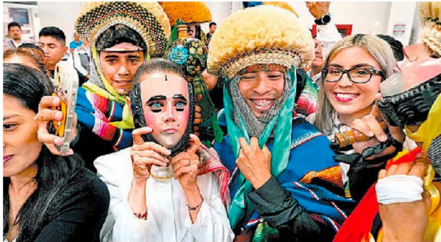
La Presidenta informó en Chiapas que Rutilio Escandón se integrará a su gobierno. ESPECIAL