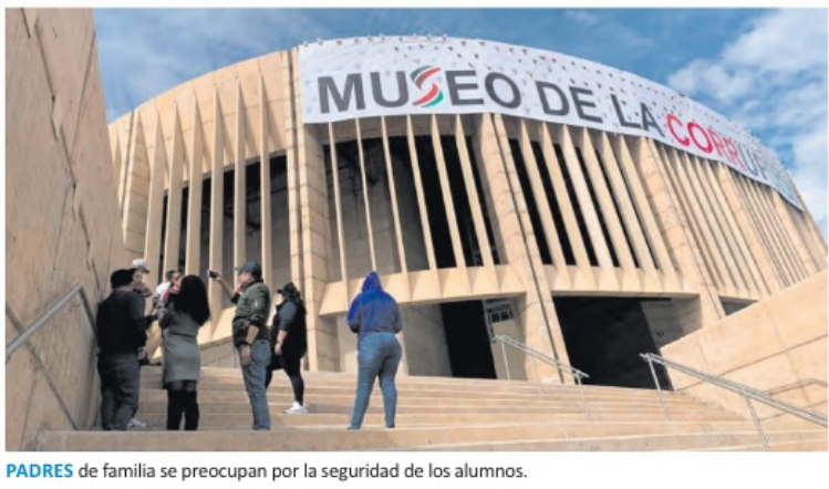
PADRES de familia se preocupan por la seguridad de los alumnos.