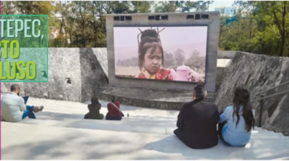
CARDOS MORA / EL UNIVERSAL