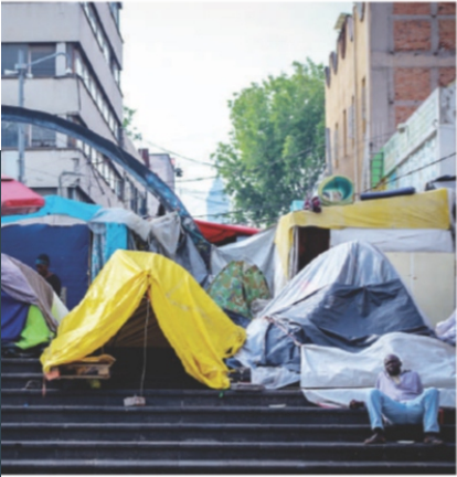
CAMPAMENTO en Plaza de la Soledad.

DANIEL y Darío habitan en cuartos de madera en Plaza de la Soledad; ahí, subsisten vendiendo comida de su país y se mueven entre puestos de dulces y barberías. pág. 6