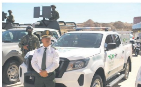
DIERON el banderazo autoridades estatales y federales.

La funcionaria explicó que el operativo se realizará las 24 horas a partir del viernes y hasta el 8 de enero. Más allá de atender incidentes mecánicos, los elementos estarán capacitados para orientar a quienes circulen por las carreteras para dar a conocer rutas y lugares turísticos. Agregó que en cada estado se ofrecerán las joyas de cada región