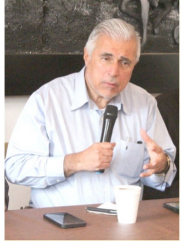
José Narro Céspedes