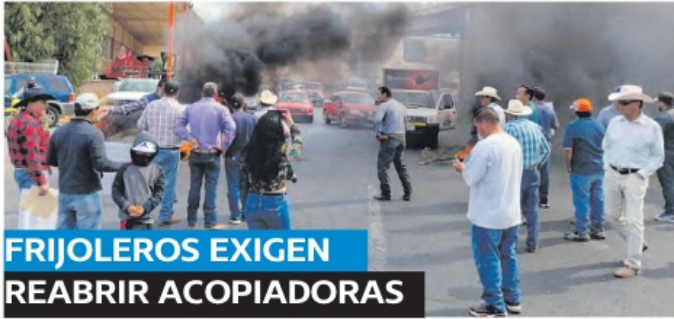
FRIJOLEROS EXIGEN REABRIR ACOPIADORAS

RECOMENDACIÓN 8M CUMPLIREMOS A CNDH: REYES; DEBE HABER SANCIONES: SENADOR METRÓPOLI A3