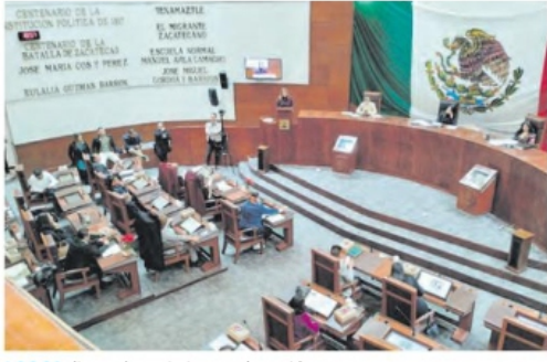
LOS 30 diputados asistieron a la sesión.