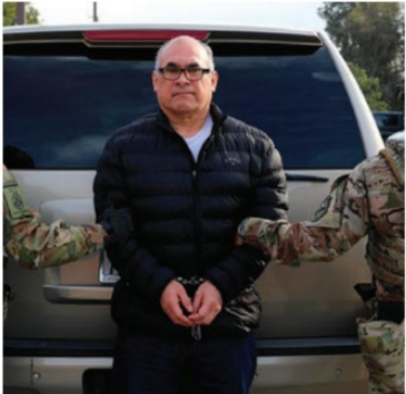
Osiel Cárdenas Guillén, exlíder del Cártel del Golfo, fue ingresado al Altiplano.