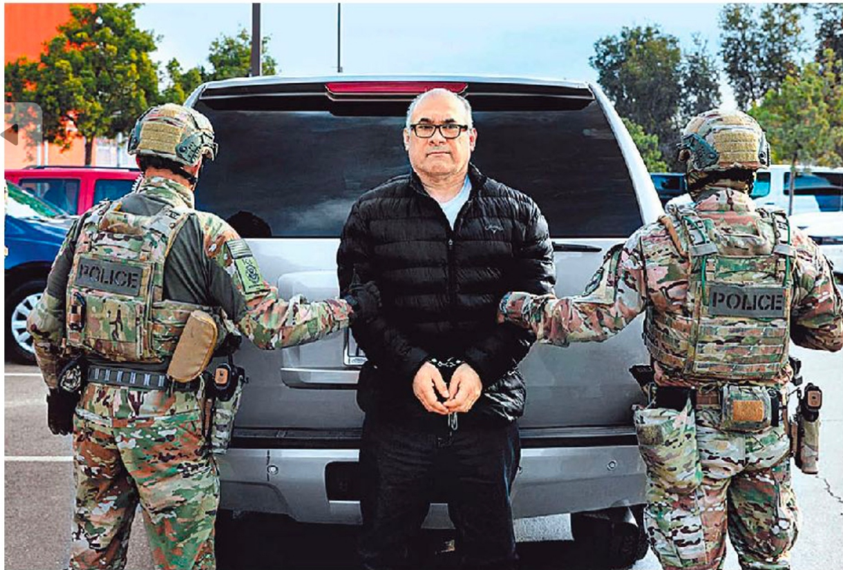
El ex capo mayor del cártel del Golfo ya afronta cargos aquí que pueden sumar sentencias hasta por 730 años de prisión.

Violencia en Michoacán Asesinan a dos militares con mina; otros cinco, heridos ELIZABETH GUZMÁN - PÁGS. 6 Y 7