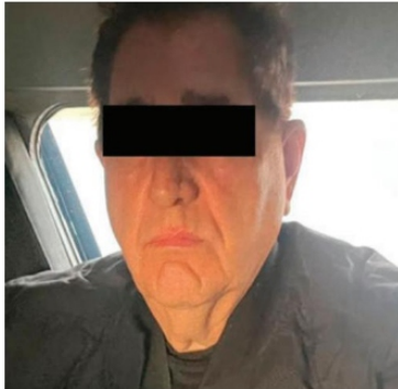
...Y detienen en Sinaloa a "El Mero Mero", vinculado con fentanilo.