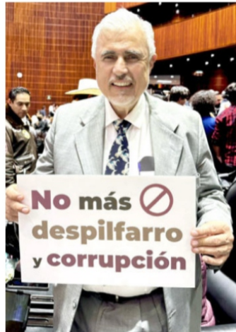
José Narro Céspedes