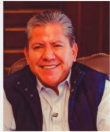
DAVID MONREAL, gobernador.

No cabe duda que la entrada del 2025 trae consigo un panorama político distinto a lo que hemos visto en el periodo de administración de la "nueva gobernanza",