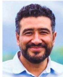
RODRIGO CASTAÑEDA, secretario de Economía.

En su última medición de competitividad urbana, la zona metropolitana Zacatecas-Guadalupe se coloca en la posición 19 de 20 entre las zona con una población entre 250 y 500 mil habitantes, y basta decir que no existe una sola población medida en la entidad que supere los