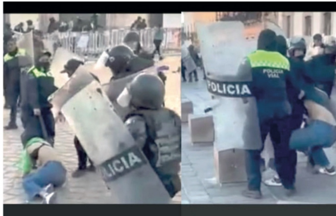
Fue brutal la represión ordenada por David Monreal Ávila y su testaferro Rodrigo Reyes Mugüerza

Aguascalientes, Guadalajara y a la misma capital del país, porque en su propia tierra no le dan chance de hacerlo.