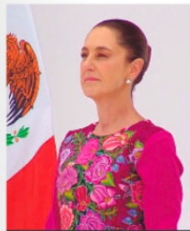
CLAUDIA SHEINBAUM, Presidenta de México

La presidenta de México reconoció que el impacto directo de la planta permitirá mejorar el acceso a