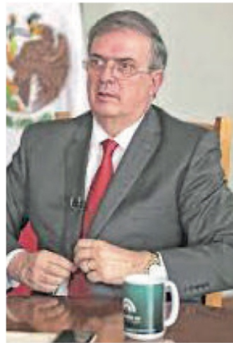
Marcelo Ebrard Casaubón