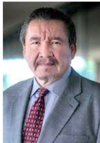
Rodolfo Monreal Ávila

Luna se quedó muy corta le faltó el Rodolfo Monreal Ávila, exalcalde de Fresnillo y actual coordinador general de Desarrollo Tecnológico y Proyectos Especiales de Sinaloa.