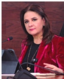
JULIETA DEL RÍO, comisionada INAI.

"El que nada debe, nada teme", dijo la comisionada del INAI, Norma Julieta del Río Venegas , quien estuvo ayer en el informe de los comisionados del Instituto Zacatecano de Acceso a la Información (IZAI), y confirmó que una vez que deje el cargo, ya que el Instituto Nacional desaparecerá oficialmente el 20 de marzo, regresará a