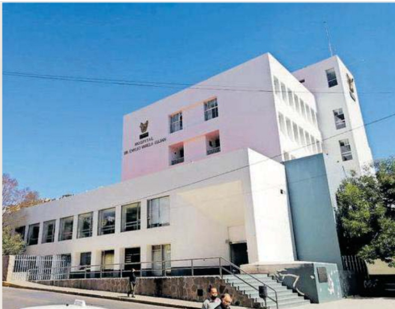
EL SOL DE ZACATECAS

Durante el 2024 , el Instituto Mexicano del Seguro Social (IMSS) fue la dependencia gubernamental del sector salud con mayor número de quejas en contra, las cuales fueron recibidas y canalizadas por la Comisión de Derechos Humanos del Estado de Zacatecas. Durante el año anterior se recibió un total de 59 quejas en el área de la salud. Pág. 7