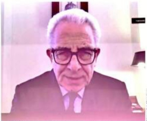
El exPresidente Zedillo participó ayer en una videoconferencia transmitida en el ITAM.