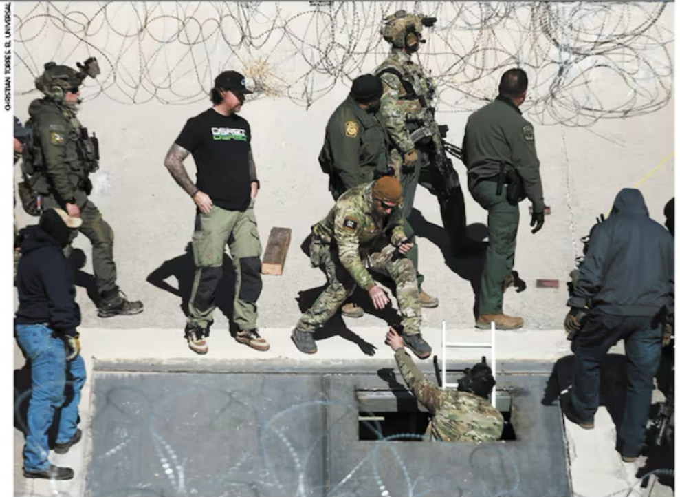
Fuerzas estadounidenses desmantelaron el túnel que conectaba la frontera de Ciudad Juárez, Chihuahua, con El Paso, Texas.