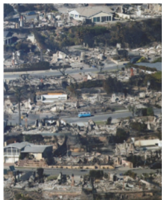
VISTA aérea muestra devastación en Pacific Palisades, en Los Angeles, California, ayer.