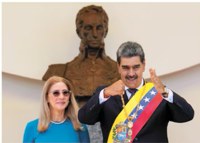
Nicolás Maduro, después de su ceremonia de juramento en la Asamblea Nacional, en Caracas.

33.2% CAÍDA EN ASISTENCIA A CINES en México respecto a 2019.