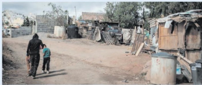
SUFREN por las heladas en Tierra y Libertad.