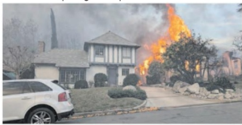
INCONTABLES familias perdieron sus hogares.