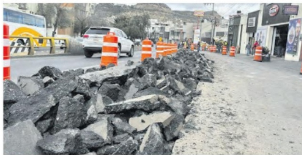
CONTINÚAN los trabajos preliminares en el bulevar metropolitano.

“No hay coordinación entre autoridades y gasolineras para la operatividad de los negocios, por eso estamos tratando de reunir-