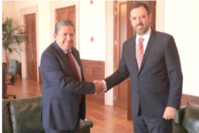
David Monreal Ávila y Alejandro Tello Cristerna