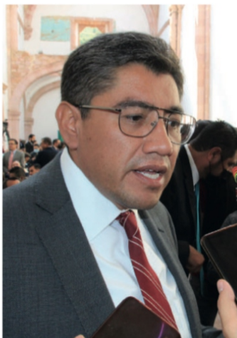
Saúl Monreal Ávila