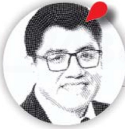
Saúl Monreal Ávila