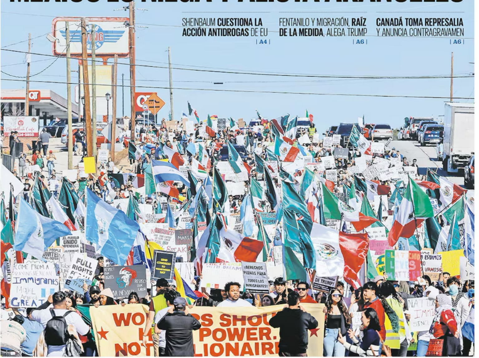
Latinos en Estados Unidos salieron ayer a las calles de Atlanta para protestar contra las redadas y la deportación masiva de extranjeros indocumentados por parte de la administración de Donald Trump. | A6 |

CANADÁ TOMA REPRESALIA Y ANUNCIA CONTRAGRAVAMEN | A6 |