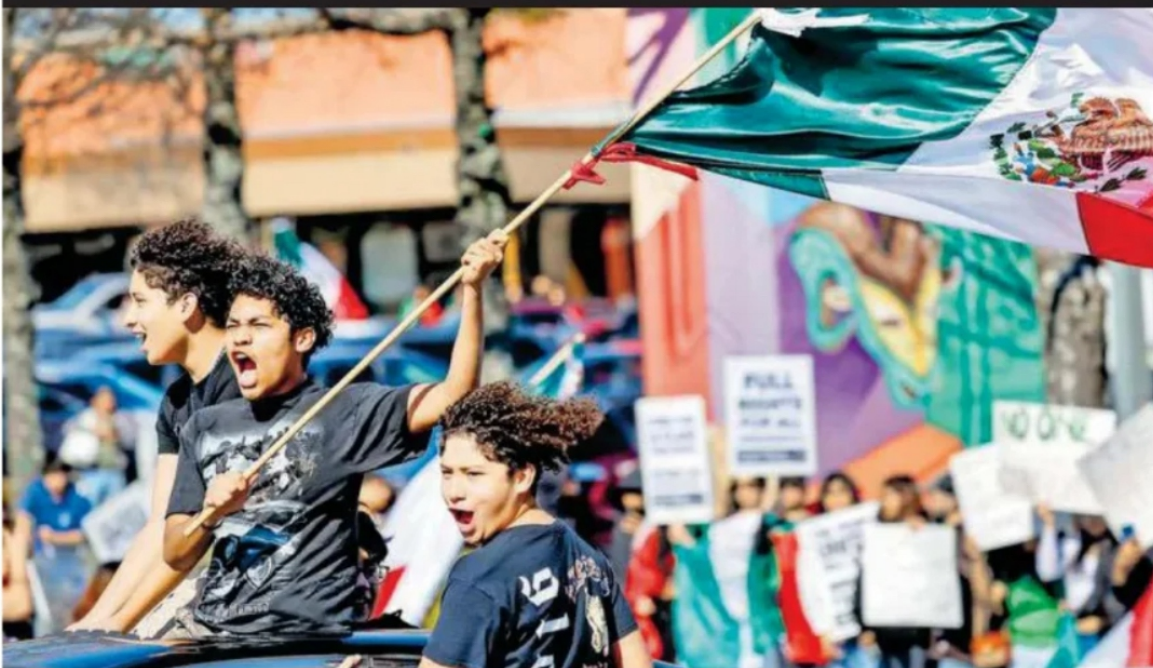
ERIK S. LESSERVE

Cientos de migrantes, la mayoría mexicanos, protestaron el sábado a lo largo de la autopista Buford, en Atlanta, Georgia, en contra de las redadas de inmigración y deportación de la administración Trump