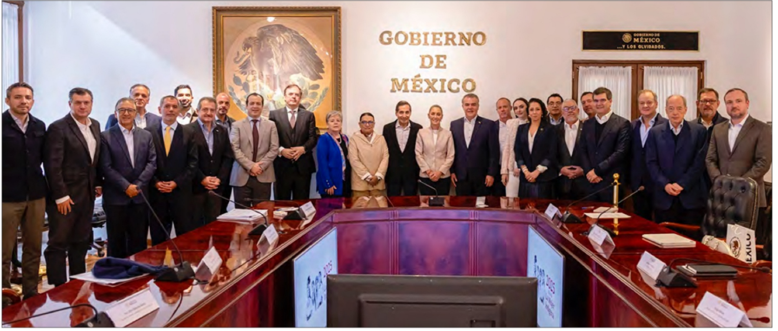
▲ Representantes del sector empresarial acudieron a Palacio Nacional la mañana de ayer para manifestar su respaldo a la jefa del Ejecutivo.