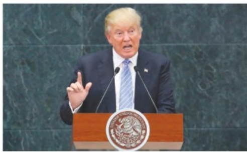
EL MANDATARIO estadounidense concretó la imposición de aranceles de 25%.

Además, la mandataria de México aseveró: “si en algún lugar existe tal alianza es en las armerías de los Estados Unidos”. También instruyó a la Secretaría de Economía a implementar el Plan B, que incluye