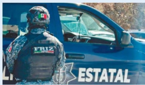
LOS SEÑALAN de agredir a un joven en Guadalupe.