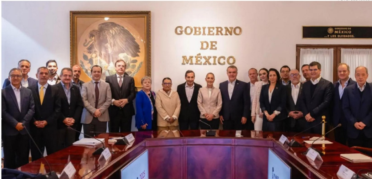
La Presidenta Claudia Sheinbaum se reunió este sábado en Palacio Nacional con empresarios del país para revisar y discutir los planes y avances del "Plan México", ante la imposición de aranceles a productos mexicanos por parte del gobierno de Donald Trump.