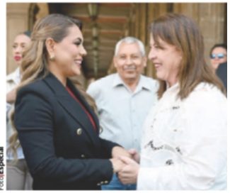
EVELYN Salgado y Margarita González Saravia, ayer.

LA GOBERNADORA de Guerrero y Margarita González impulsarán crecimiento económico; se reúnen ayer. pág. 4