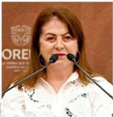
Margarita González Saravía, Gobernadora de Morelos, y el diputado Cuauhtémoc Blanco.