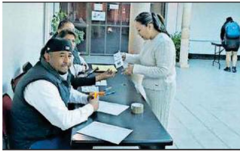
CORTESÍA PAULINA C RIOS