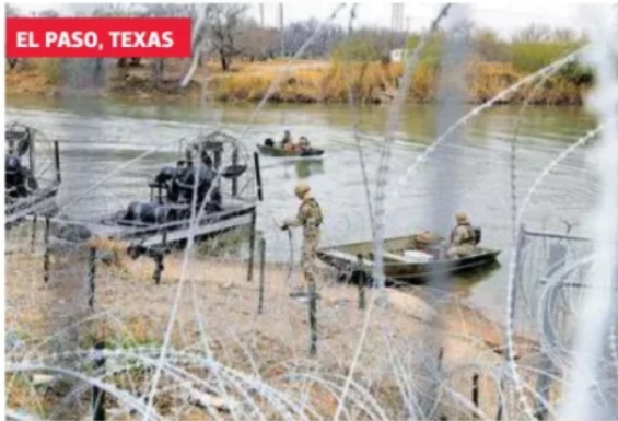
EL PASO, TEXAS