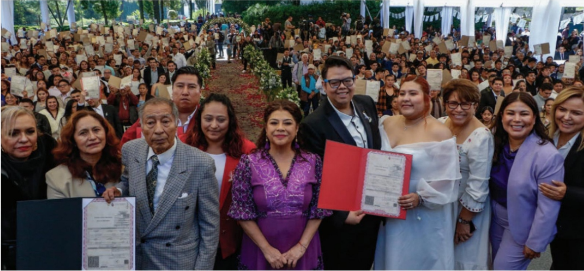
El Día del Amor y la Amistad fue celebrado de manera especial en el Complejo Cultural Los Pinos, donde se llevó a cabo la boda colectiva "Amor es Amor", que reunió a más de 500 parejas de diferentes edades y trayectorias. PAG.9