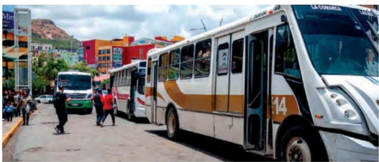
EL COSTO actual es de 9.50 pesos.

La mañana de este viernes, en conferencia de prensa, concesio-