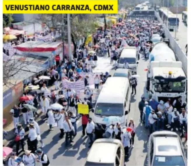
VENUSTIANO CARRANZA, CDMX