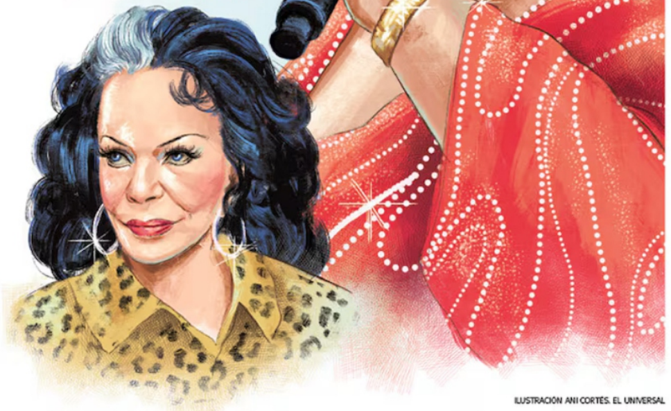
ILUSTRACIÓN ANI CORTES. EL UNIVERSAL

La intérprete de Me saludas a la tuya cantó contra los hombres y se convirtió en la voz de las mujeres, mientras que Yolanda Montes, con sus exóticos bailes y su mechón blanco representó la feminidad en la Época de Oro del Cine y de las rumberas. | A25 Y A27 |