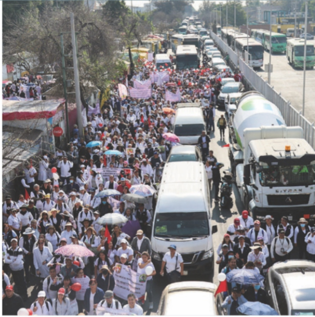
TRABAJADORES del Sector Salud, ayer, en un bloqueo cercano al aeropuerto.

LLEGAN a acuerdos con Segob; complican aún más el tránsito protestas del sector salud por falta de insumos.