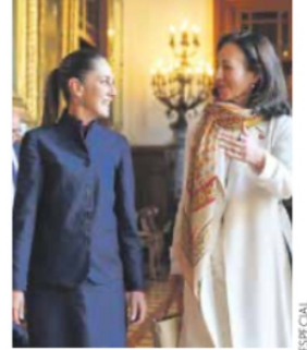
Palacio. Sheinbaum se reunió con Ana Botín, presidenta de Santander.