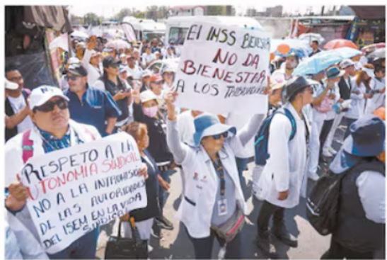
Trabajadores del sector salud mexicano se manifestaron ayer sobre Ignacio Zaragoza y el cruce con Circuito Interior en demanda de insumos.