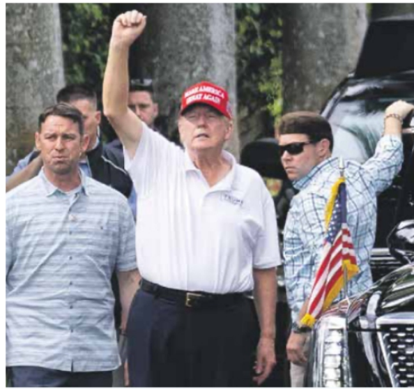
Equilibrar el comercio. Cobraría a otros países la misma tasa que imponen a EU.