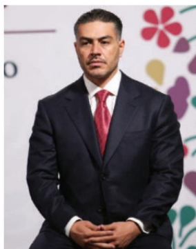
Omar García Harfuch.

El canciller Juan Ramón de la Fuente, como cabeza del grupo negociador, Marcelo Ebrard en el