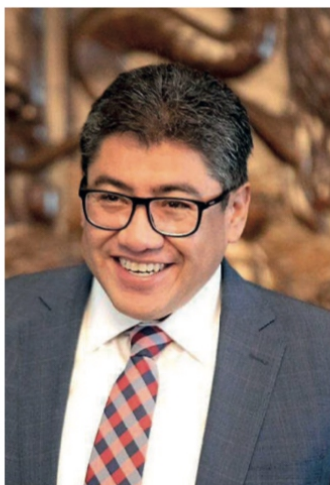
Saúl Monreal Ávila