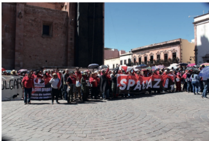
No vamos a hacer nada que los afecte: Claudia Sheinbaum