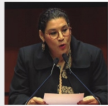
LENIA BATRES, ministra SCJN.

La decisión de aprobar una Ley contra el nepotismo electoral, y su entrada en vigor hasta el 2030, es una extraordinaria estrategia de distracción social para que mientras avancen en el país temas que al Gobierno le interesa mantener en la discreción social. La distracción crece porque no existe nepotismo donde la voluntad popular se manifiesta, ya que el único espacio donde hay nepotismo es en los