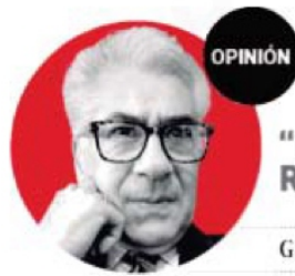
GERARDO DE ÁVILA

7. Ante la notoria ausencia del gobernador David Monreal Ávila en las negociaciones con el magis-