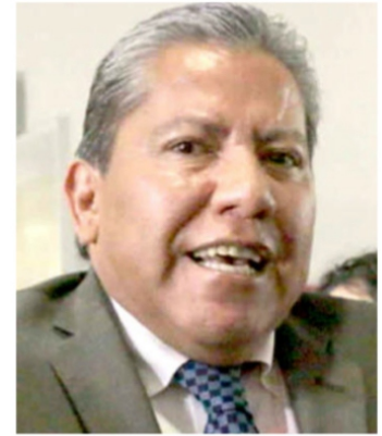
David Monreal Ávila ...entierra a Morena ...

Hay municipios en los cuales el narco es el que domina: Apulco y Pinos principalmente; en este municipio,