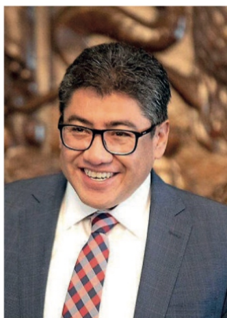
Saúl Monreal Ávila