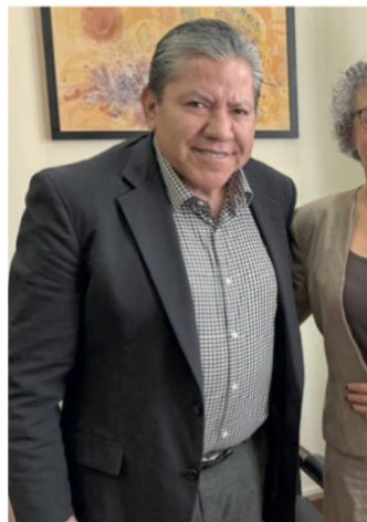
David Monreal Ávila