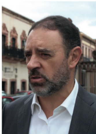
Alejandro Tello Cristerna