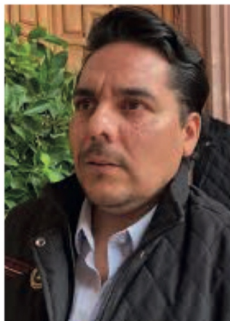
Jeu Márquez Cereso