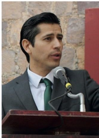
Julio César Chávez Padilla