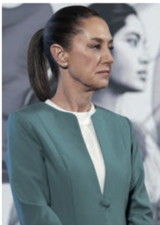
Claudia Sheinbaum Pardo