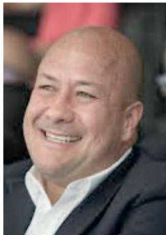
Enrique Alfaro Ramírez

dar el programa al que le puso ‘Corazón Contento’.