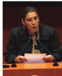
LENIA BATRES, promueve la elección del Poder Judicial.

Urge nombrar autoridades comprometidas que impulsen mejoras reales en la educación superior del estado.