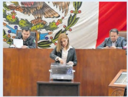
SE DEFINIERON las candidaturas en un proceso de insaculación.