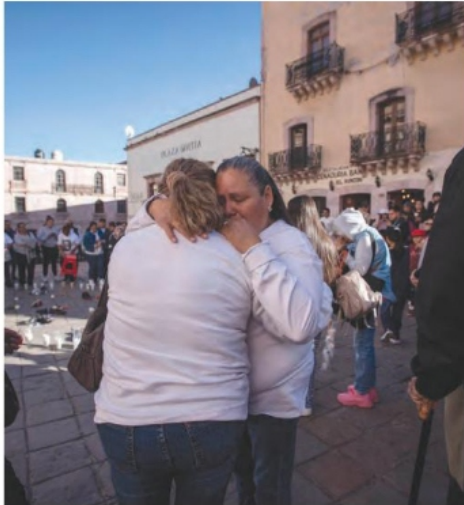
EXPRESARON su solidaridad con los Guerreros Buscadores de Jalisco.

Teuchitlán expone la profunda y grave crisis moral y humanitaria en la que