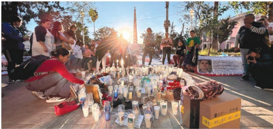
EN FRESNILLO, madres buscadoras se reunieron alrededor del Árbol de la Esperanza.