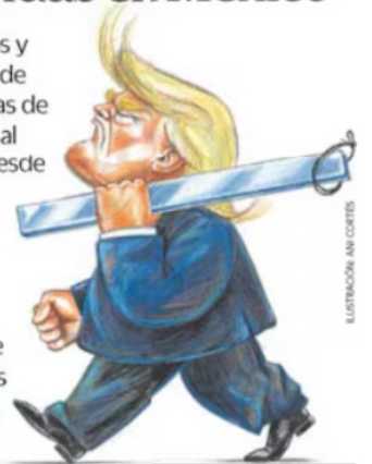
ILUSTRACIÓN: ANI CORTÉS