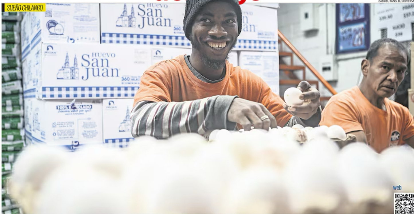
La Ciudad de México ha acogido a migrantes de distintas nacionalidades que, en su camino a EU, se han quedado a habitarla. Los principales sitios donde han hallado trabajo, dicen entrevistados, son los mercados. | A6-A7 |