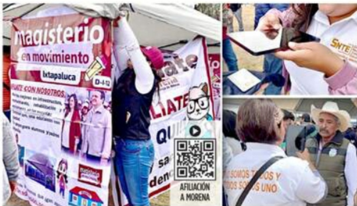
Maestros de Puebla instalaron un módulo para invitar a los asistentes al evento de Sheinbaum en Tlaxcala a sumarse a Morena.

El activismo partidista del SNTE ocurre mientras la disidencia de la CNTE, tradicionalmente aliada a la 4T, amagó con un paro nacional indefinido si no les entregan dinero de las Afores para incrementar las pensiones de retiro de los maestros. La Coordinadora ha retado a la Presidenta Sheinbaum a que cumpla un acuerdo que aseguran haber tenido con AMLO en el sexenio anterior para derogar la Ley del