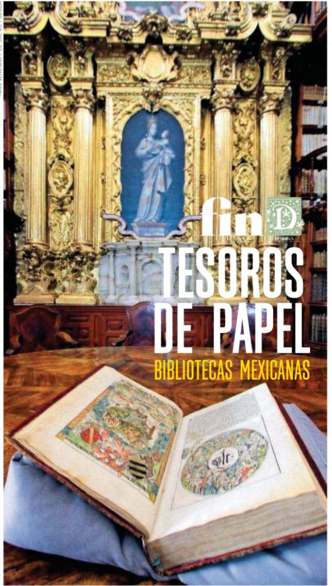
IVAN VENEZAS / EL SOL DE PUEBLA

fin D TESOROS DE PAPEL BIBLIOTECAS MEXICANAS