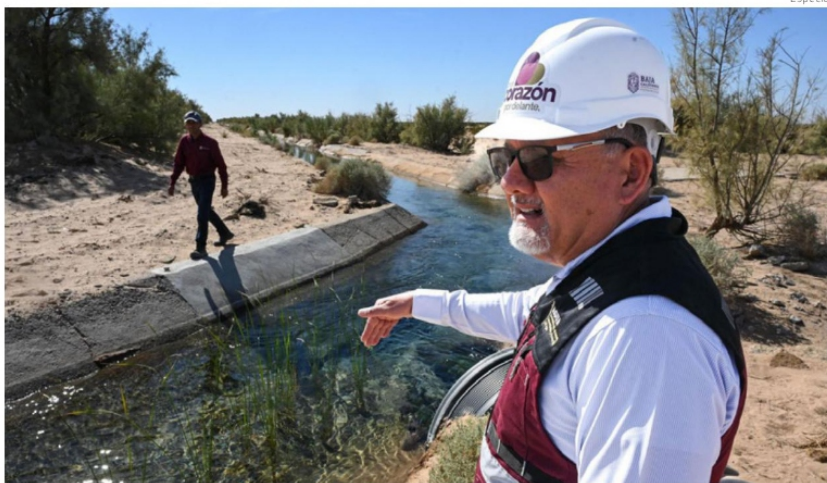
La Secretaría para el Manejo, Saneamiento y Protección del Agua de Baja California ha minimizado la negativa de EU de entregar agua del Río Colorado, pero este problema podría agravar más las divergencias entre México y el vecino país.

Al problema de aranceles a productos mexicanos por imposición de Donald Trump, una nueva crisis entre ambos países se asoma y es la distribución del agua, y es que ante el incumplimiento por parte de México a entregar este recurso del Río Bravo a Texas, según un acuerdo de 1944, ahora como represalia, el Departamento de Estado de EU rechazó vender y entregar agua para Tijuana procedente del Río Colorado, lo que abre una nueva crisis. Pag 5