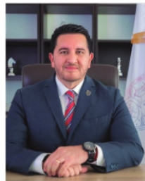
JAVIER TORRES , alcalde de Fresnillo.

El grupo Ciudadanía Participativa de Zacatecas no quita el dedo del renglón y sigue firme en su oposición al viaducto elevado que pretende construirse en la capital del estado. A través de una nueva convocatoria, invita a la ciudadanía a sumarse este lunes 14 y martes 15 de abril en la Plazuela de la Caja, para recabar firmas y documentos que serán utilizados en los amparos colectivos contra la obra. Con el lema "¡No al segundo piso!", la organización insiste en que el proyecto podría poner en riesgo el nombramiento de Zacatecas como Ciudad Patrimonio Cultural de la Humanidad, concedido por la UNESCO.