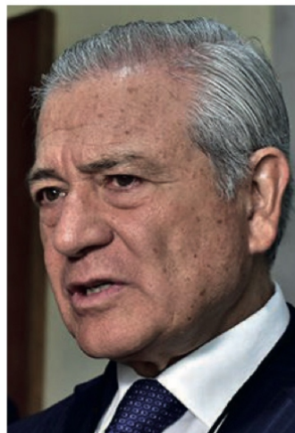
Genaro Borrego Estrada

-OJALÁ y todos los servidores públicos fueran como mi presidenta: 4X4 todo terreno, entonces sí, agárrense, porque nadie detendría al país.