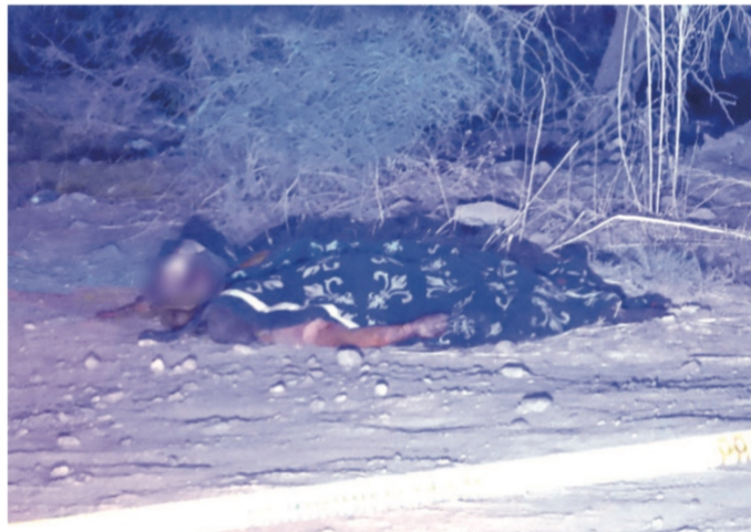
Uriel ‘N’ de 17 años, masacrado