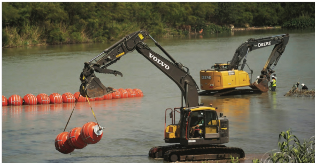
▲ La idea es continuar con la medida sin precedente impuesta por el gobernador republicano de Texas, Greg Abbott, quien