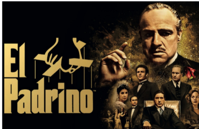
Me hicieron recordar la película “El Padrino”; “Te haré una oferta que no podrás rechazar” la gubernatura de Zacatecas, por impunidad