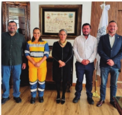
AUTORIDADES DE LOS AYUNTAMIENTOS de Zacatecas y Guadalupe.

Que este ejercicio marque un precedente: las políticas públicas no dependen de una sola figura, sino de equipos sólidos con objetivos comunes. La ciudadanía gana cuando el diálogo sustituye a las excusas y los compromisos superan las apariencias.