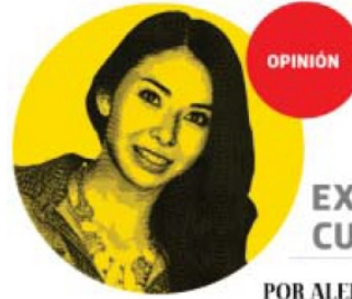
POR ALEJANDRA DE ÁVILA