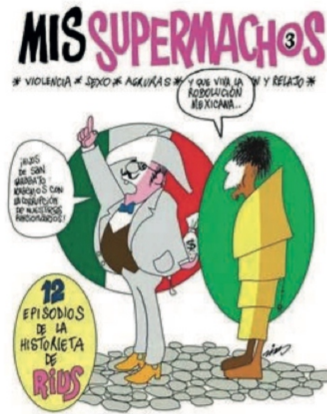
Portada de Los Supermachos de Rius