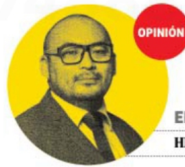
EL ESPECTADOR HIROSHI TAKAHASHI

Como diría el gran José Alfredo, con este gobierno, "es preciso decir una mentira". La moralidad no está en el arte ni en la música. La iniciativa de Sheinbaum es una salida falsa. No se puede combatir la violencia "a su manera".