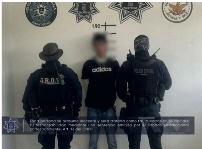
Toda persona se presume inocente y será tratada como tal, mientras no se declare su responsabilidad mediante una sentencia emitida por el Órgano jurisdiccional correspondiente. Art. 13 del CNPP

ada día aumentan los jóvenes que tuercen el camino hacia las drogas