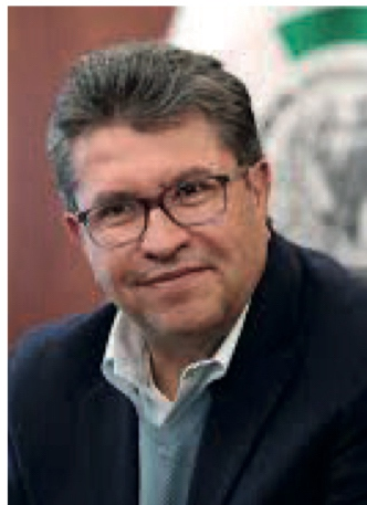
Ricardo Monreal Ávila