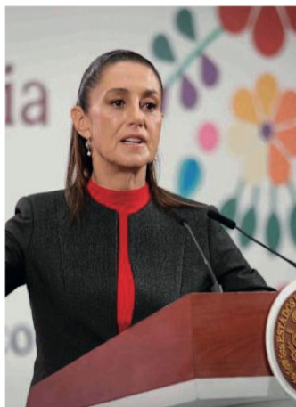
Claudia Sheinbaum Pardo