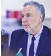
ALFONSO RAMÍREZ CUÉLLAR, diputado federal

El informe legislativo de Alfonso Ramírez Cuéllar , que se celebrará este viernes en el Hotel Parador, no será únicamente un ejercicio de rendición de cuentas, sino también una muestra de su experiencia y estrategia política. Al convocar a actores de todas las