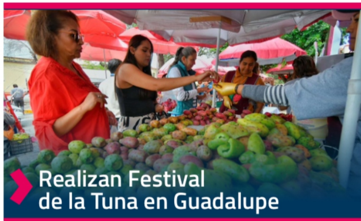
➤ Realizan Festival de la Tuna en Guadalupe