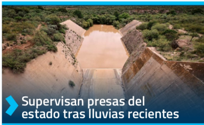
➤ Supervisan presas del estado tras lluvias recientes

La Ruta del pueblo originario Huichol, peregrinaje precolombino que recorre en México los sitios sagrados hasta Wirikuta -en el centro y oeste del país-, entró en la lista del Patrimonio Mundial de la Unesco, anunció el Comité de Patrimonio del organismo reunido en París, Francia.