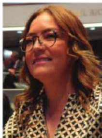
LA SENADORA VERO DÍAZ, prepara ver informe.

Rumbo a las elecciones de 2027, los aspirantes a la gubernatura de Zacatecas se han desatado. En todos los frentes se multiplican los informes legislativos, las reuniones masivas y las giras de trabajo que, aunque con apariencia institucional, tienen un claro propósito político: medir fuerzas. Las plazas, auditorios y teatros se han convertido en escenarios donde cada gesto, cada aplauso y cada fotografía cuenta en la construcción de una candidatura anticipada.