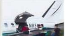
LA PROHIBICIÓN "Las prácticas de cabotaje por parte de permisionarios extranjeros en territorio mexicano están prohibidas". (Art. 17 Bis de la Ley de Aviación Civil)

El avión, un Socata TBM850, tiene matrícula N850KLL, de Estados Unidos y es legal rentarlo en México (cabotaje).