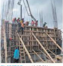
EL SECTOR creció 17.5%.