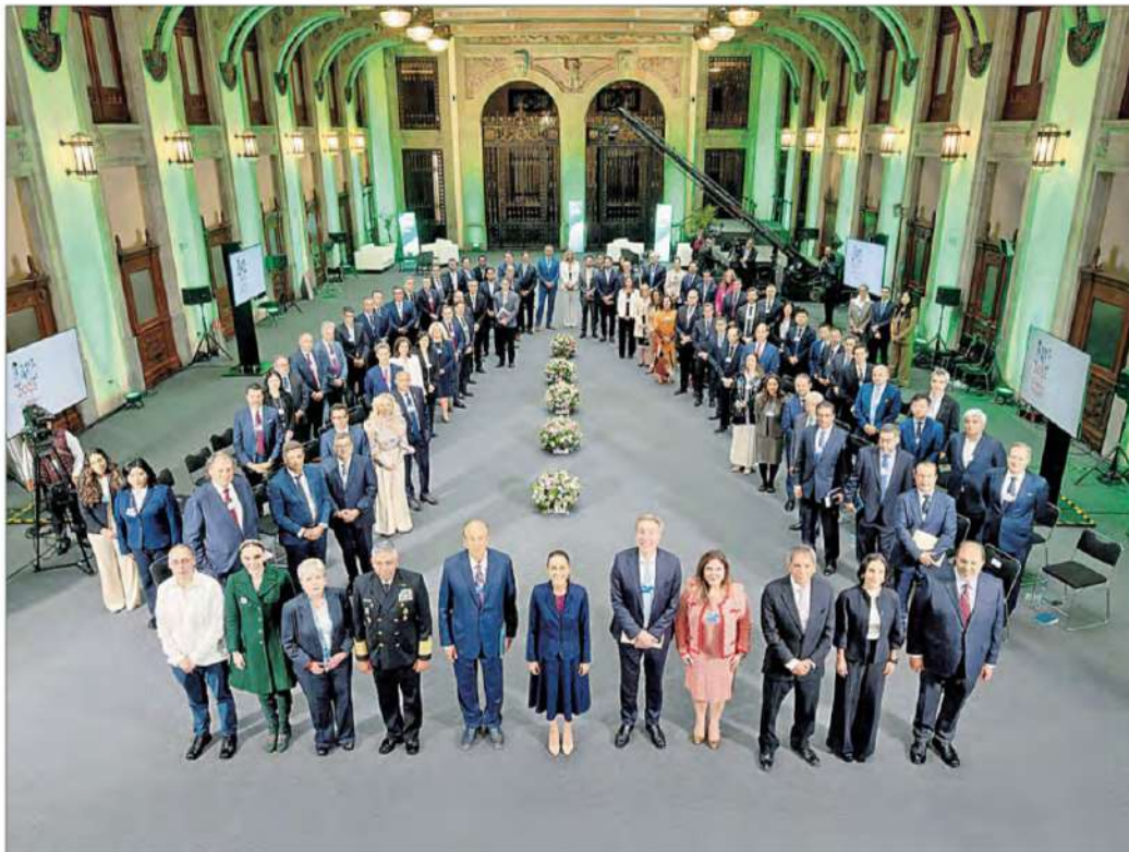
▲ En un encuentro en Palacio Nacional ayer, la presidenta Claudia Sheinbaum destacó ante integrantes del Foro Económico Mundial su optimismo sobre el crecimiento de México y la buena relación de su gobierno con los socios comerciales de América del Norte y resaltó