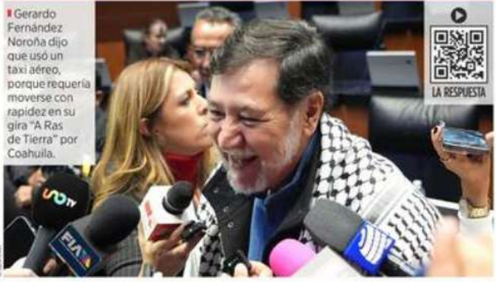
Gerardo Fernández Noroña dijo que usó un taxi aéreo, porque requería moverse con rapidez en su gira "A Ras de Tierra" por Coahuila.

AMENAZAN A PREPA Y FACULTAD Presuntos miembros del "Bloque Negro" responsables de agresiones a policías el pasado día 2, ahora, embozados y encapuchados, intentaron tomar la Prepa 8, en Plateros. Tras una posesión momentánea del plantel se dirigieron a la Facultad de Derecho donde fueron rechazados por los estudiantes. CIUDAD