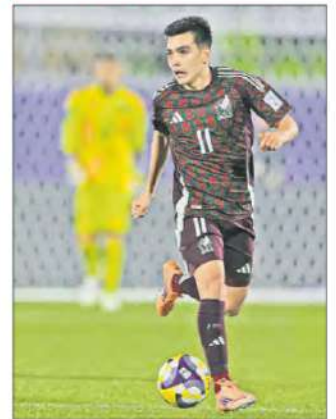
▲ La solicitud hecha por aficionados al Vasco Aguirre evidencia el temor ante jóvenes promesas del fútbol que han truncado sus carreras debido a los excesos. Foto Afp K. TORRIJOS / DEPORTES