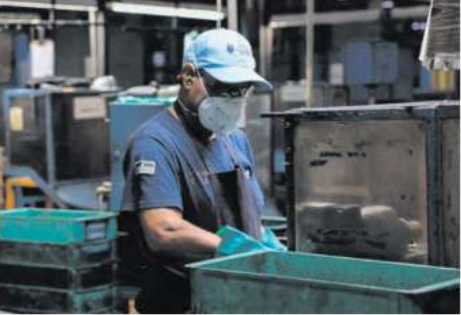
SEZAC destacó que se recuperaron trabajos en agosto y septiembre.