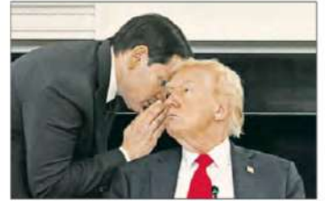
▲ El republicano informó del convenio en su red Truth Social. Aquí, con el secretario de Estado, Marco Rubio.

● El norte de Gaza “sigue siendo zona de combate peligrosa”, advierte Tel Aviv