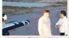
EL TAXI-AÉREO... ILEGAL El senador Gerardo Fernández Noroña dijo que usó un taxi aéreo para realizar una gira por el estado de Coahuila.

El avión, un Socata TBM850, tiene matrícula N850KLL, de Estados Unidos y es legal rentarlo en México (cabotaje).