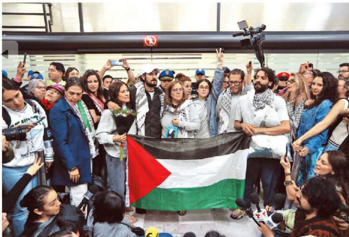
Los seis conacionales de la flotilla deportados reivindicaron su travesía en resistencia contra la invasión a la Franja.

Efecto de tarifas y China La gasolina enamora otra vez a firmas automotrices FINANCIAL TIMES - PAG. 20