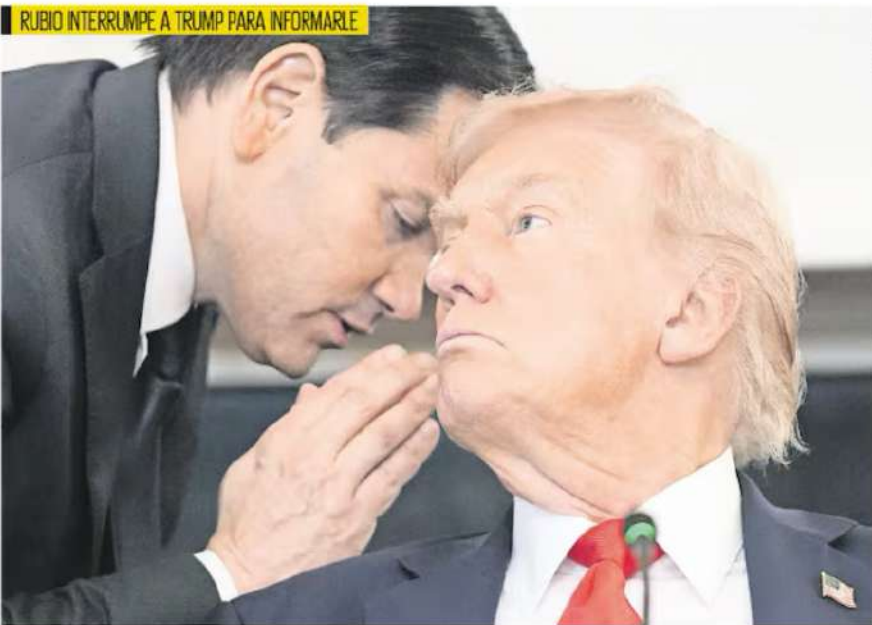
EVAN AGOSTO, AP MICHAEL LEWIS