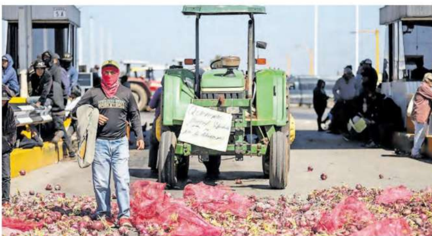
● PRODUCTORES y jornaleros protestaron en la caseta de Calera.

Desde aproximadamente las 8 horas de este martes, en decenas de autobuses, tractores y camionetas que jalaban trailas cargadas de cebolla, comenzaron a desplegarse en distintos puntos carre-