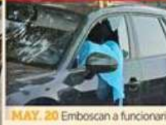
MAY. 20 Emboscan a funcionarios del primer círculo de Brugada.