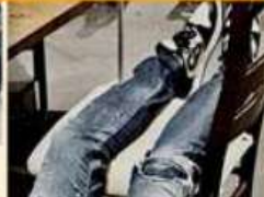
OCT. 17 Abogada penalista es asesinada en Viaducto.