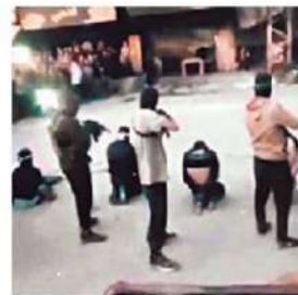
Emprenden purga.

La milicia islámica difundió en video la ejecución de palestinos considerados "colaboracionistas" con Israel. PÁGS. 16 Y 17