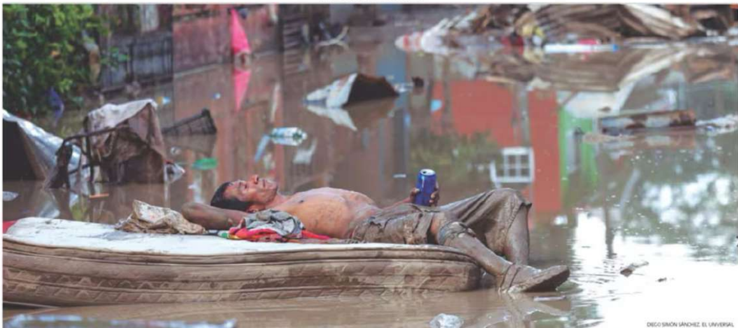
Diego Simón Sánchez, El Universal