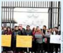
El paro en la oficina de Hidalgo 77, en la CDMX.

Los trabajadores de las oficinas recaudadoras de Hidalgo y Paseo de la Reforma, en CDMX, así como de Chihuahua, Celaya, Guadalajara y Zapopan, acusaron también falta de personal, horarios extensos, asignación de plazas