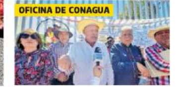
OFICINA DE CONAGUA