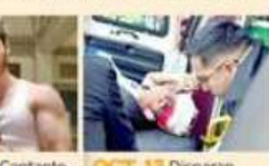
OCT. 9 Cantante argentino es asesinado.