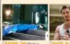
SEPT. 29 Matan al influencer Miguel de la Mora.