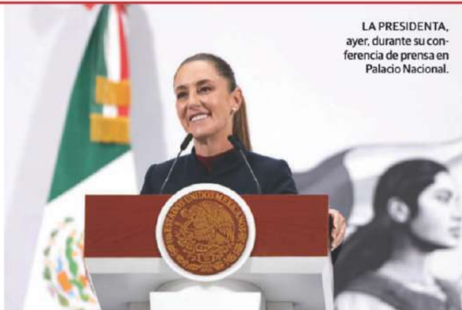
LA PRESIDENTA, ayer, durante su conferencia de prensa en Palacio Nacional.

5 Mil espacios de Jóvenes Construyendo el Futuro para llevar apoyo de limpieza