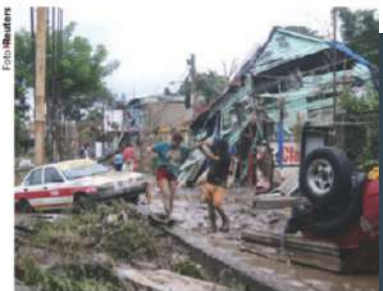
AFECTACIONES, ayer, tras las lluvias en Poza Rica, Veracruz.

INCOMUNICADAS. 307 comunidades en La Huasteca; damnificados temen hallar más muertos bajo escombros. págs. 6 a 8