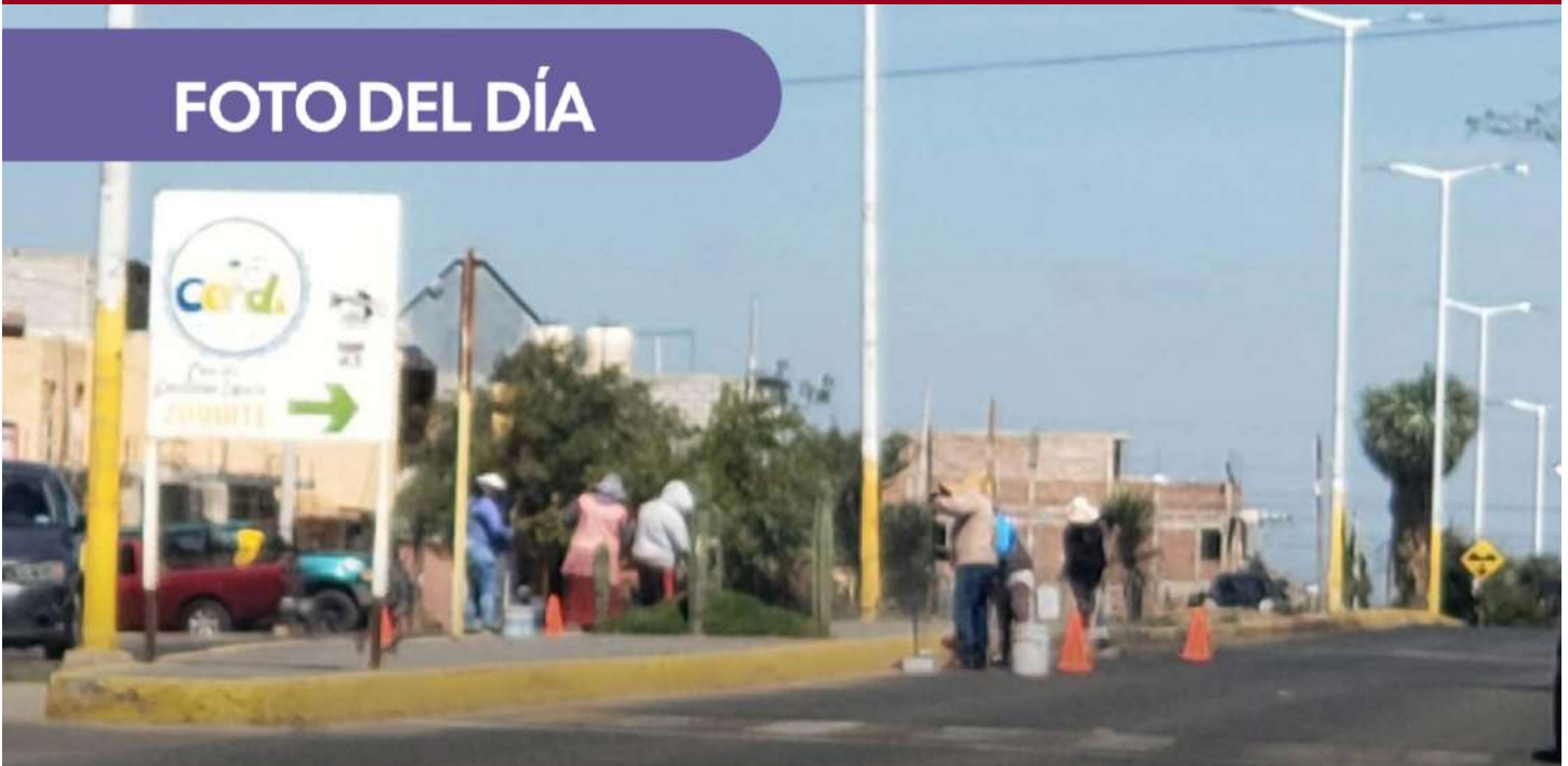
FOTO DEL DÍA