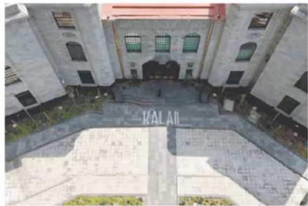
A pesar de que ya fue inaugurado, el Museo Kalan sigue sin abrir al público.

Datos oficiales manejan diferentes cifras: desde los 282 millones de pesos a los 359 millones