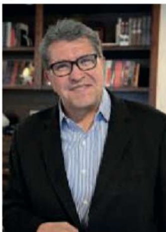
Ricardo Monreal Ávila