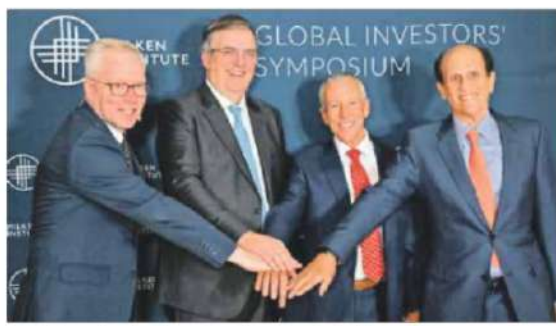
Acuerdos regionales. A principios de noviembre habrá definiciones arancelarias.

“Hemos tenido algo así como 85 reuniones con la USTR en este proceso. Ha sido muy intenso. Tenemos una base de confianza”