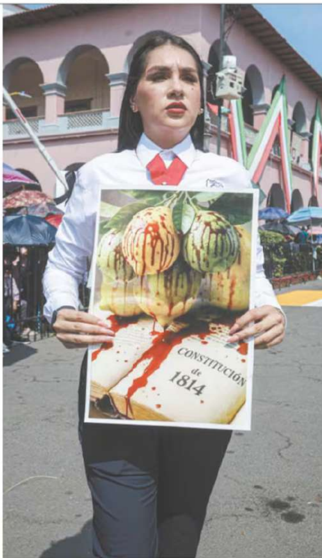
En el desfile, maestros y estudiantes portaron pancartas con limones ensangrentados.