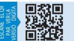
ESCANEA EL QR PARA VER LA VERSIÓN DIGITAL