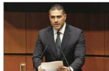
▲ El secretario de Seguridad compareció ayer en el Senado.