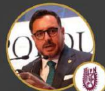
Instituto Politécnico Nacional