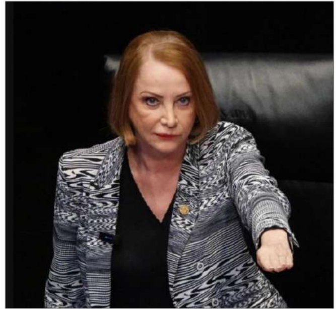
▲ Laura Itzel Castillo, presidenta del Senado de la República.

—Decía que si había un resquicio, había que ir por ahí. Él buscó que todo se hiciera con apego a la Constitución, porque la Carta Magna nos da garantías individuales de libertad de expresión, de libertad de organización. Pienso que el tiempo le dio la razón, porque a través de un movimiento pacífico fue que la izquierda triunfó; después de una lucha muy larga en la que se fusionaron las izquierdas y el nacionalismo revolucionario del pueblo.