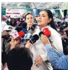
Ariadna Montiel.