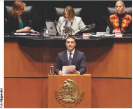
OMAR García Harfuch, ayer, en el Senado.