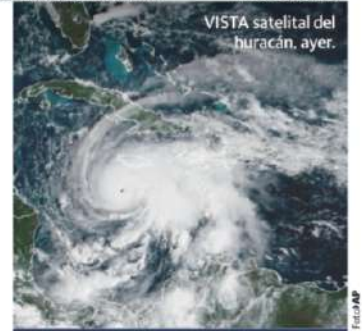
VISTA satelital del huracán, ayer.

Afirma que en unas semanas se llamarán nuevamente; señala que aplazamiento es para seguir trabajando en 54 barreras comerciales; expertos ven respiro por el momento pág. 22