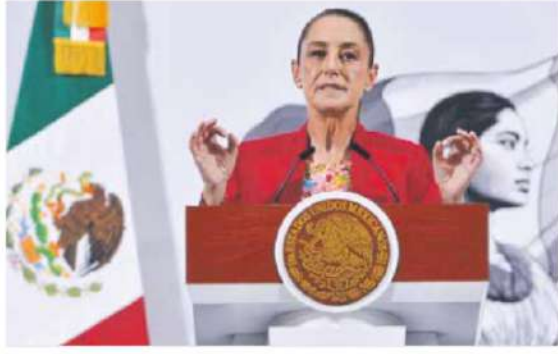
Apizamiento. Se retrasa nuevamente el cobro de mayores impuestos a México.

La presidenta Claudia Sheinbaum dijo que en la décima llamada que tuvo con Donald Trump, el sábado pasado, ambos coincidieron en que "vamos muy bien". Sin embargo, reconoció que no está desactivado el amago de imponer aranceles. "Vamos a dar unas semanas más para cerrar el tema, que va muy avanzado sobre las 54 barreras no arancelarias pendientes. Acordamos hablar en unas semanas", aclaró. Coincidieron en que hay avances en seguridad, migración y comercial. La posibilidad de hablar en breve refleja la intención de ambos de mantener el diálogo. —E. Ortega / J. Valdeamar / PÁG. 4