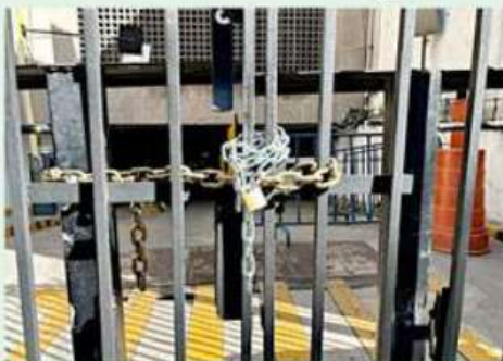
Campesinos colocaron cadenas y candados en la Segob.

indefinidos, dijo. En Jalisco tenemos 89 puntos, Michoacán tiene 20, en 24 estados nos estamos levantando. Están las caravanas en todos los puntos, hay tractores, hay caballos, describió.