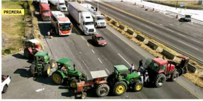
PRIMERA CAMPEÑINOS TOMAN CARRETERAS