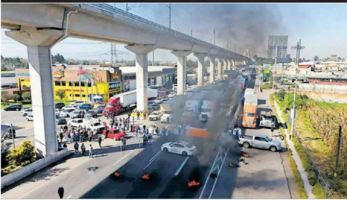
RAMOS MERCATO / EL SOL DE TOLUCA