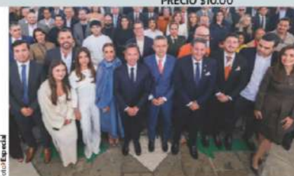
PABLO LEMUS, ayer, con la plana mayor de MC, en su Primer Informe de Gobierno.

Identifica fiscal a agresor de Manzo: un menor de 17 años al que vinculan con el CJNG; colectivos piden evitar criminalización de muchachos reclutados por delincuencia; maestra exige rescatarlos