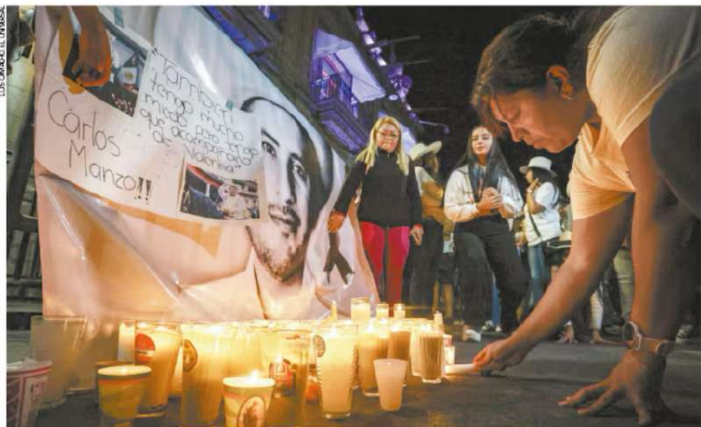
Pobladores se congregaron en la Plaza Morelos en memoria de Carlos Manzo. Colocaron cartulinas y lonas con la imagen del alcalde y encendieron veladoras. Caminaron hacia el Palacio Municipal, en una marcha pacífica y en silencio por la paz y justicia.

Dos personas acompañaron durante el día del homicidio del alcalde de Uruapan al autor material, que fue identificado, da a conocer la Fiscalía de Michoacán