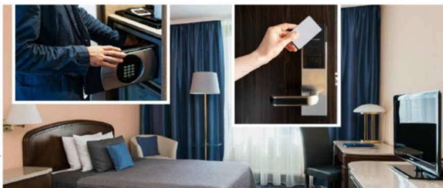
EN LA HOTELERÍA la seguridad es un factor clave para el éxito y la competitividad, para mejorar el mercado nacional e internacional.