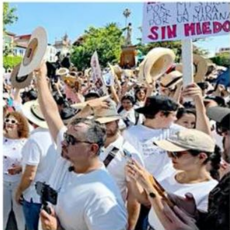
Simpatizantes del Movimiento del Sombrero participaron en la movilización.

"Como quedó claro en la elección judicial del 1 de junio, cuando eliges mucho, no eliges nada. Si bombardeamos a los electores de cientos de temas, candidaturas y boletas, los incapacitamos para votar de forma libre e informada. Los acordeones son resultado de eso", señaló.