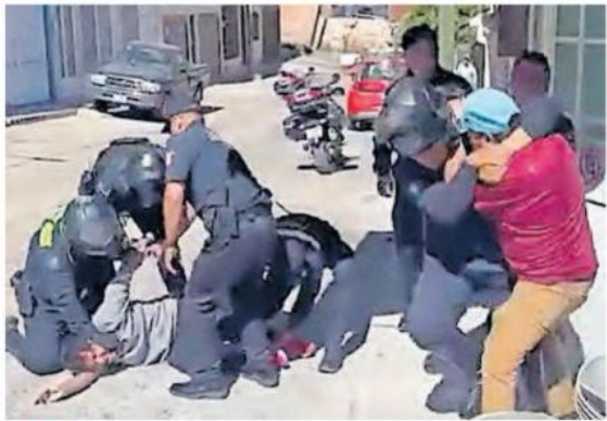
VARIOS agentes sometieron a un joven y su padre.

Al llegar más agentes, cinco sometieron con golpes al muchacho en el piso, mientras dos más empujaron contra una ventana y tiraron al suelo a otro hombre, quien se acercó para intentar calmar la situación. A este último lo libera-