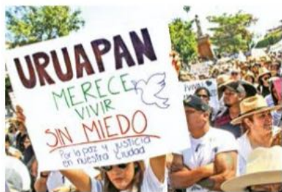
Miles de uruapenses alzaron la voz contra la inseguridad que padecen y reclamaron falta de acción del gobierno.