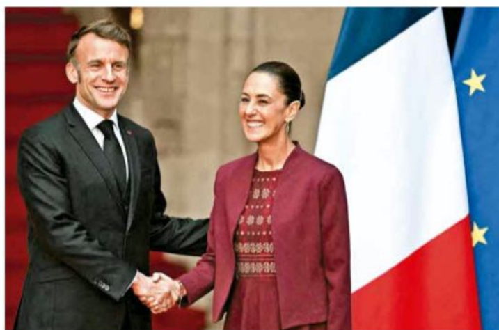
La presidenta Sheinbaum se reunió en Palacio Nacional con el mandatario francés, Emmanuel Macron.

EN SU REUNIÓN con la presidenta Sheinbaum, el mandatario galo anunció que 700 empresas mantendrán la creación de empleos en sectores clave, como el aeronáutico y ferroviario