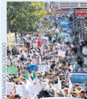
LA MAYORÍA vistió de blanco.