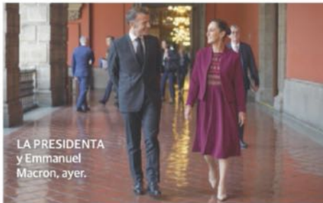
LA PRESIDENTA y Emmanuel Macron, ayer.

Mandatario destaca respeto a soberanía de cada nación en lucha contra narco, sobre ataque de Trump a narcolanchas; hay colaboración en seguridad, asegura Sheinbaum