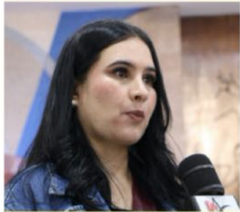
"En Zacatecas Está Penalizado el Acoso"