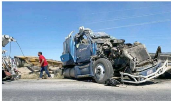
Son muchos los accidentes que provoca el pésimo estado de las carreteras en Zacatecas

- OJALÁ Y el siguiente gobernador, o gobernadora, le ponga más interés a la infraestructura de calidad; tan bonita nuestra capital del estado, hasta parece una ciudad europea.