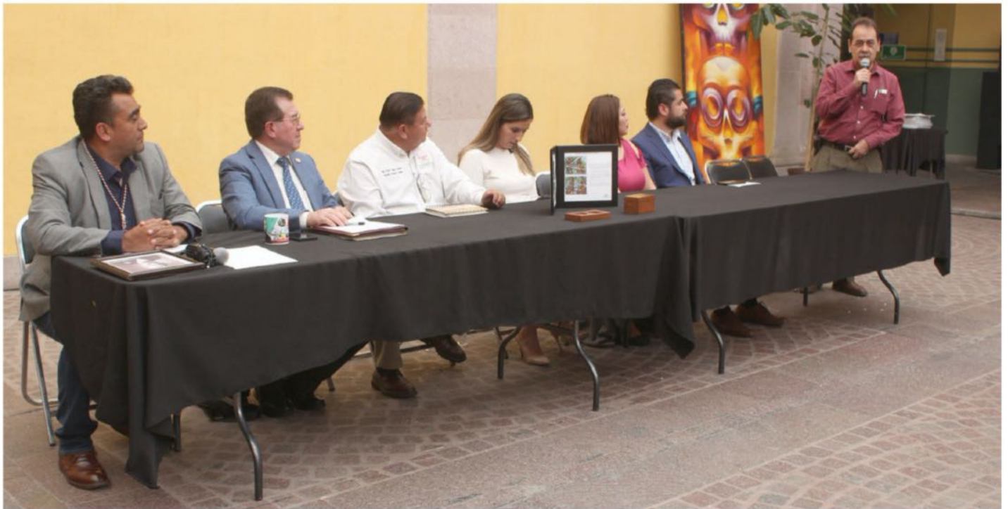
El evento se realizó en la Casa Municipal de Cultura de Zacatecas

Cancelación Oficial de Planilla Postal "Heroínas Forjadoras de la Patria"