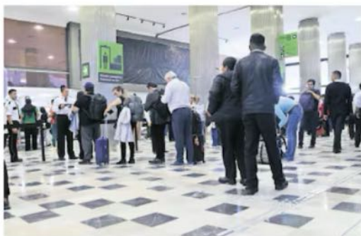
Los rostros detectados se contrastarán con bases de datos locales o externas, entre ellas "listas negras", se detalla en la licitación.

Texto: PEDRO VILLA Y CAÑA —nacion@eluniversal.com.mx