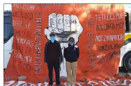
▲ Este miércoles, se registró un intenso caos vial en diversas partes de la zona conurbada Guadalupe - Zacatecas, luego de que estudiantes de la Normal Rural de San Marcos "General Matías Ramos Santos" bloquearan el boulevard José López Portillo para exigir que la Secretaría de Educación de Zacatecas (Seduzac) que les restituya un apoyo económico para realizar sus prácticas profesionales; aunque se entabló una mesa de diálogo, no hubo acuerdos y la protesta se extendió durante todo el día.