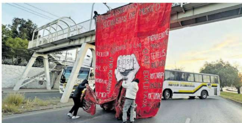
COLOCARON camiones en la principal vialidad de la capital.

con autoridades, decidieron la suspensión de actividades en la Normal y emprendieron la jornada de protestas. En tanto, desde la puerta trasera de las