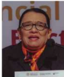
ROSA ICELA , visitó Zacatecas en un día complicado.

Rosa Icela Rodríguez no necesitó informes ni diagnósticos técnicos para constatarlo; bastó recorrer las calles paralizadas para entender que aquí, la política interna se le fue de las manos al gobierno estatal.