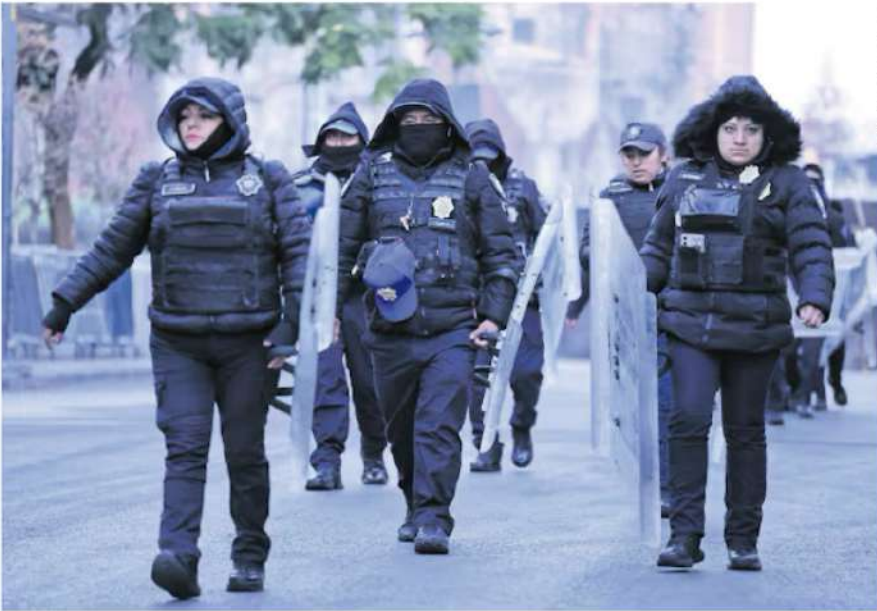
FERNANDA KJURB, EL UNIVERSAL

Elementos de la Secretaría de Seguridad Ciudadana caminaron por el Zócalo rumbo a la calle de Pino Suárez, luego de romper filas tras su formación matutina. Vestidos con gruesas chamarras y gorros, los uniformados avanzaron en medio del aire helado que cubría el Centro Histórico por el paso del frente frío número 13.