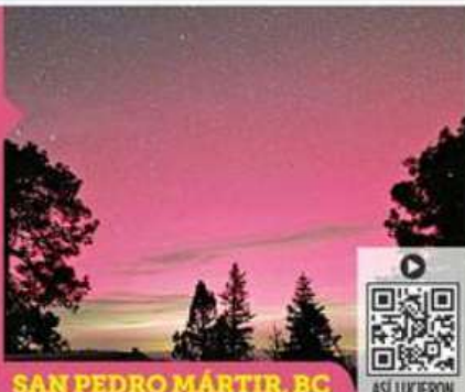
SAN PEDRO MÁRTIR, BC

Mientras en Europa, Canadá y EU reportaron impactos en las comunicaciones GPS y la red eléctrica por la tormenta geomagnética de los últimos días, en México las auroras boreales provocadas por ese fenómeno sorprendieron al norte del territorio. PÁG. 12