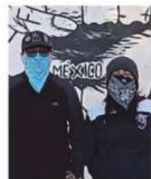
ALUMNOS DE LA NORMAL DE SAN MARCOS , no logran acuerdo con Gobierno del Estado, siguen bloqueos

El conflicto entre los normalistas de San Marcos y las autoridades educativas ha rebasado el ámbito académico para convertirse en un síntoma claro de la crisis de credibilidad que vive el gobierno estatal. Nadie parece tener el oficio político ni la autoridad moral para conducir el diálogo ni para poner límites a los excesos.