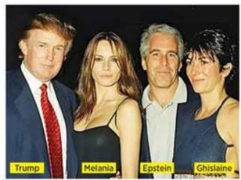
Aunque hay versiones que aseguran que Trump conoció a Ghislaine Maxwell en el 2000 (foto), a través de Epstein, se conocieron en la Semana de la Moda de Nueva York.

El Departamento de Transporte de EU emitió el 15 de septiembre una orden que obligaba a las aerolíneas a disolver la alianza antes del 1 de enero. La dependencia declaró que las compañías son las principales competidoras que operan entre EU y la Ciudad de México, lo que les otorga