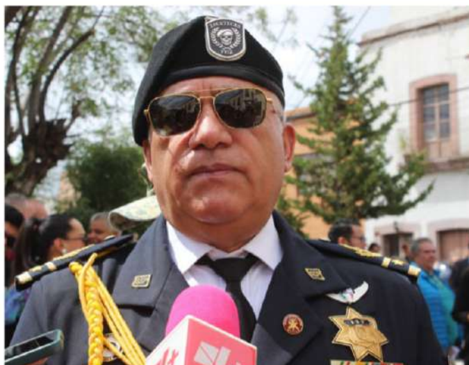
El general Arturo Medina Mayoral, haciendo apología de la muerte.