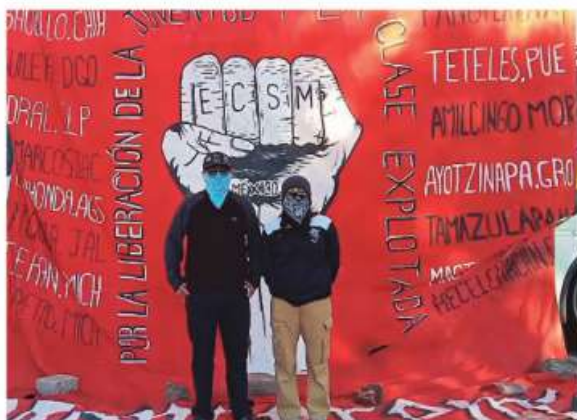
NORMALISTAS de la Normal Rural Gral. Matías Ramos Santos tomaron el bulevar.

Quizá la lección está en mirar el marcador con menos pasión y más conciencia. Porque mientras unos celebran títulos y otros bloquean calles, el ciudadano común sigue en las gradas, pagando el boleto más caro: el de la paciencia. Tal vez ha llegado el momento de dejar de aplaudir goles falsos y exigir que alguien, por fin, juegue en serio este partido llamado Zacatecas.