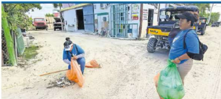
ADRIANA VILLAS, EL UNIVERSAL