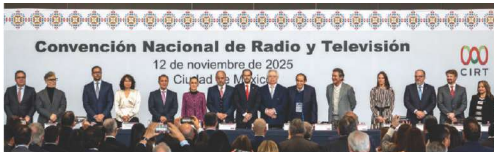
LA PRESIDENTA, ayer, con los representantes de la Cámara de la Industria de Radio y Televisión.