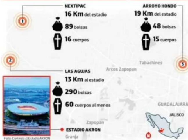
Gráfico: Daniel Rey