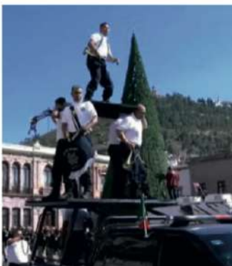
“¡Se va a caer... se cayó el ‘Cochino’!”