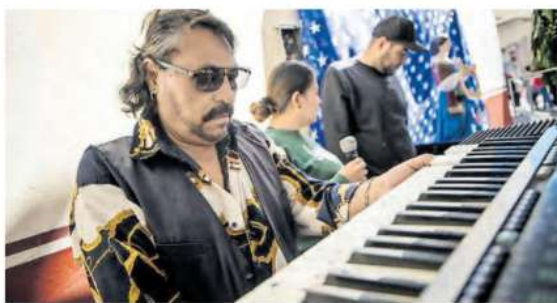
ESTE VIERNES celebraron a su santa patrona, para pedir buenas rachas de trabajo.