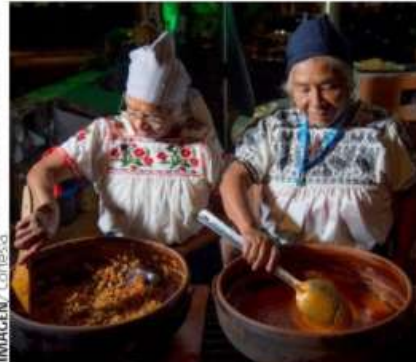
LA UNESCO reconoció a la cocina tradicional mexicana destacando su papel en la cohesión social y familiar de nuestro país.

d) Finalmente se consideraron los rituales y celebraciones que forman parte de nuestras vidas