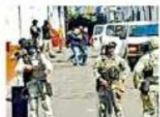
Los escoltas fueron detenidos en la Casa de la Cultura de Uruapan.

De acuerdo con reportes locales, se trata de seis hombres, integrantes de la Policía Municipal de Uruapan.