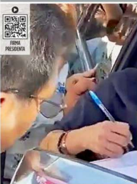
Maestros de la Coordinadora impidieron el paso a la Presidenta en Tuxtla Gutiérrez.