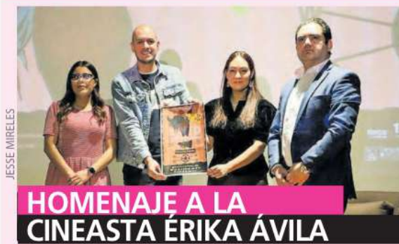
HOMENAJE A LA CINEASTA ÉRIKA ÁVILA

LA EDICIÓN 17 del Festival de Cine en Fresnillo rendirá homenaje a la guionista y cineasta zacatecana Érika Ávila Dueñas por su destacada trayectoria, además de realizar proyecciones especiales en distintas sedes del municipio.