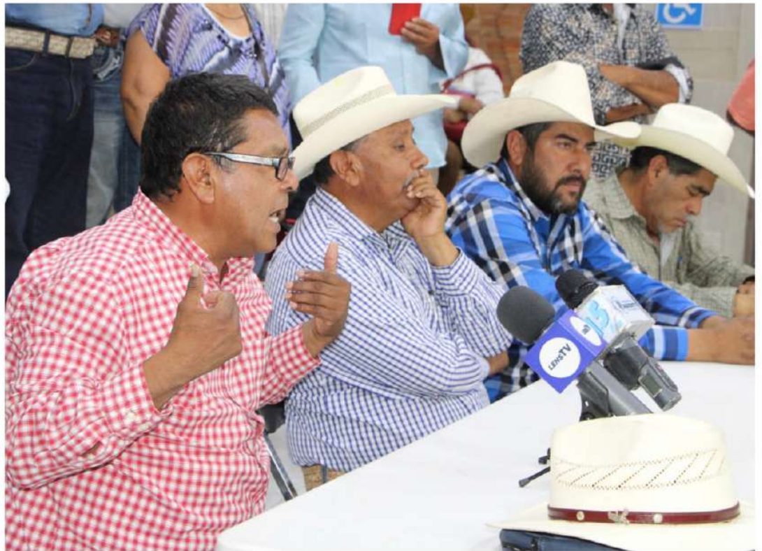
Los frijoleros anunciaron que en las próximas horas realizarán una asamblea para definir nuevas acciones de protesta