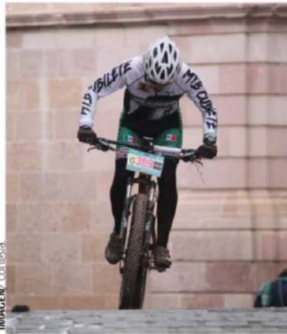
IMAGEN / cortésia

El 15 de marzo de 2026 por ejemplo, se realizó la primera edición del 21K Zacatecas, con salida y meta en la Plaza de Armas, recorriendo los puntos más emblemáticos de nuestro Centro Histórico, Patrimonio de la Humanidad. El evento convocó alrededor de 1,200 corredores provenientes de Ciudad de México, Aguascalientes, Durango, San Luis Potosí, Nuevo León, Jalisco, Puebla y otros estados, además de zacatecanos de todo el