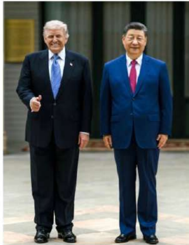
Donald Trump y Xi Jinping

4. ATANDO los cabos, no debería sorprendernos que, para Xi Jinping, lo más trascendente de la visita de Trump tenga que ver con el mensaje de fuerza alrededor de