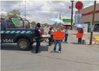
Exigen compromisos formales y por escrito del municipio

Vecinos Mantienen Bloqueo en la Carretera a Saucedá de la Borda